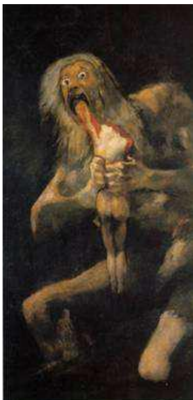
Figura: La pintura de Francisco Goya „Saturno devorando a uno de sus Niños“

Francisco Goya (1746-1828), el gran pintor Español, hizo sus propios pigmentos mediante el calentamiento y la mezcla de minerales de plomo.